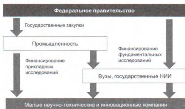
Рис. 1. Схема инновационного процесса по В. Бушу

индустриальной исследовательской лабораторией, тогда как на продуктах ближе к «конечной миле» была запущена свободная конкуренция исполнителей из частного сегмента.